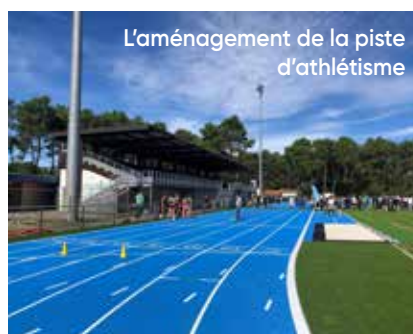
L'aménagement de la piste d'athlétisme