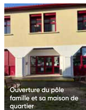
Ouverture du pôle famille et sa maison de quartier