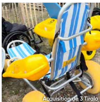
Acquisition de 3 Tiralo