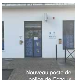
Nouveau poste de police de Cazaux