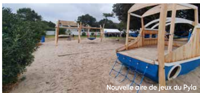
Nouvelle aire de jeux du Pyla