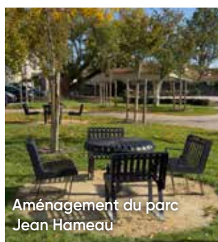
Aménagement du parc Jean Hameau