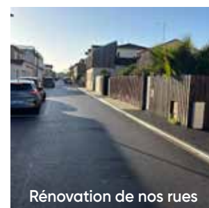
Rénovation de nos rues