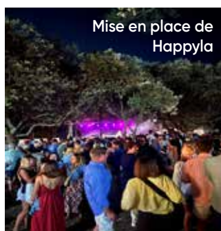
Mise en place de Happylla