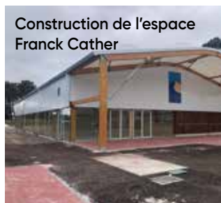
Construction de l'espace Franck Cather