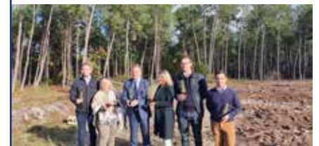
La Pinède de Conteau