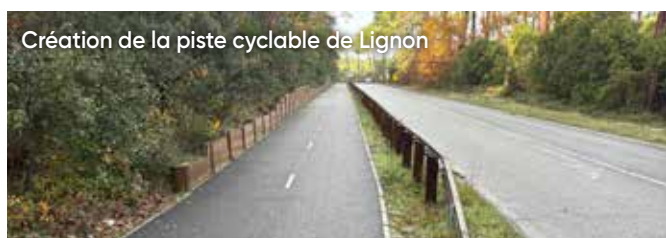
Création de la piste cyclable de Lignon