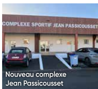
Nouveau complexe Jean Passicouset