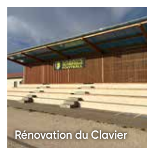
Rénovation du Clavier