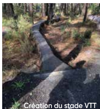
Création du stade VTT