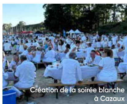
Création de la soirée blanche à Cazaux