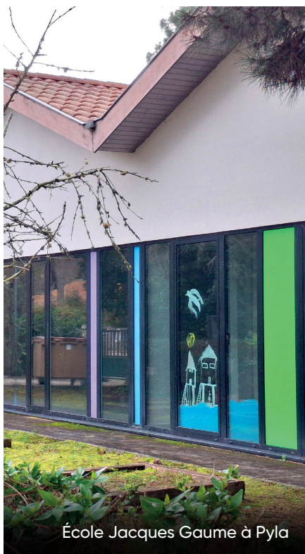
École Jacques Gaume à Pyla