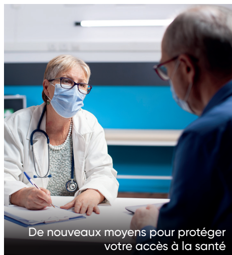
De nouveaux moyens pour protéger votre accès à la santé