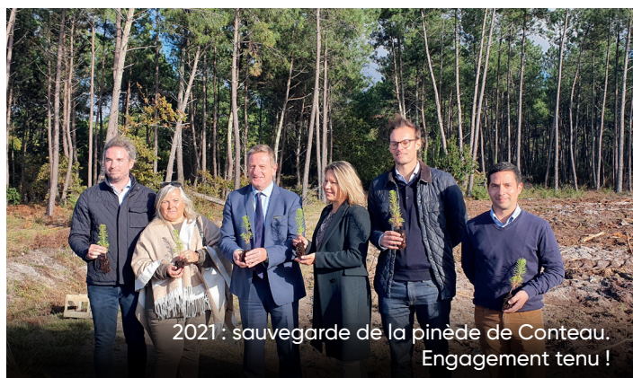
2021 : sauvegarde de la pinède de Conteau. Engagement tenu !