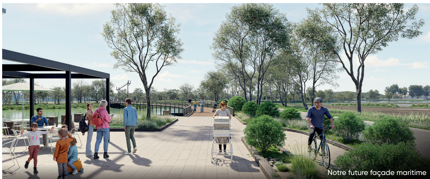
Notre future façade maritime