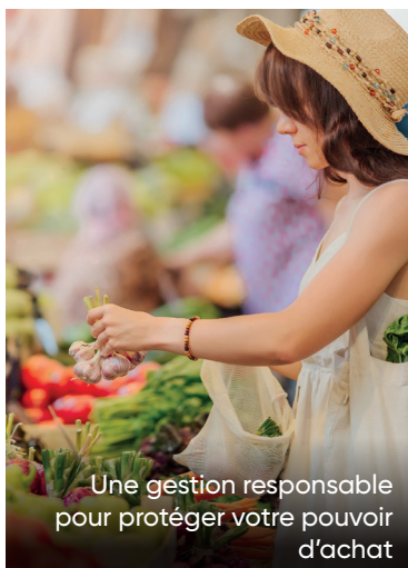
Une gestion responsable pour protéger votre pouvoir d'achat