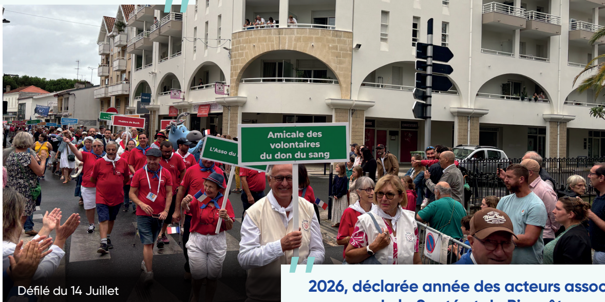
Défilé du 14 Juillet

“ 2026, déclarée année des acteurs associatifs de la Santé et du Bien-être