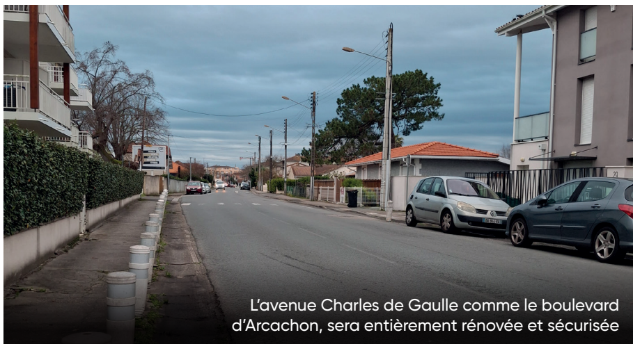
L'avenue Charles de Gaulle comme le boulevard d'Arcachon, sera entièrement rénovée et sécurisée