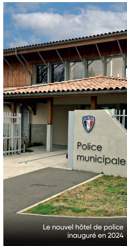
Le nouvel hôtel de police inauguré en 2024

“ Tout le monde le constate, des investissements importants ont été déployés à Cazaux, Pyla et La Teste pour notre sécurité. Notre ville est sûre ! ”