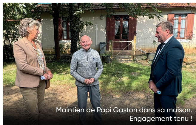
Maintien de Papi Gaston dans sa maison. Engagement tenu !