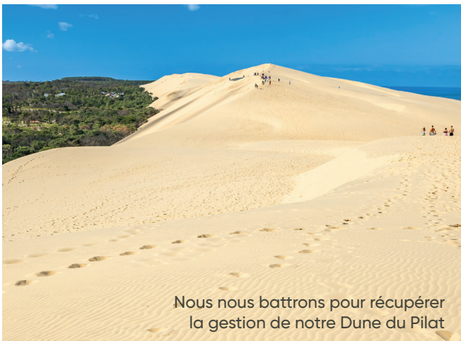
Nous nous battons pour récupérer la gestion de notre Dune du Pilat