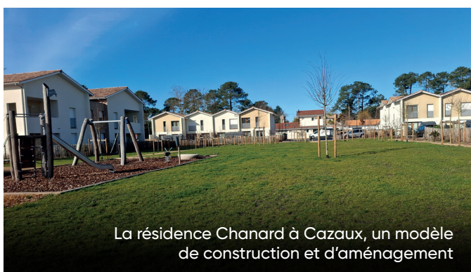
La résidence Chanard à Cazaux, un modèle de construction et d'aménagement