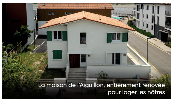
La maison de l'Aiguillon, entièrement rénovée pour loger les nôtres